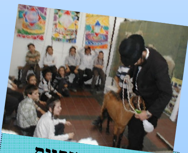
בע"ח אמיתיים אם רק אפשר..

למי? הפעילות פועלת במסגרות לימוד בדרגות פירוט משתנות בהתאם לגיל והרקע של המשתתפים. כמו כן היא מתאימה לכל מי שרוצה לארח חוויה של לעתיד לבוא.. ניתן להעביר את הנושאים בצורת הרצאה בליווי מצגת