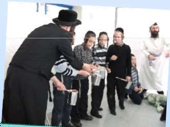
פס כסף בפסח, כמעט..

המסלולים מתוכננים בהתייעצות עם מומחים בתחום ומעוטרים בהסכמות רבות. המסלולים יכללו עזרים, תלבושות, בעלי חיים וכל אמצעי שיקרב את הנעשה לחוויה אמיתית.