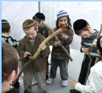
בדיקת עצים בלשכה...