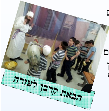
הבאת קרבן לעזרה

לימודי המקדש וקדשים גדולי הדורות הדגישו את חשיבות לימוד נושאים אלה ובייחוד בקשר לציפיה לגאולה. בדורות האחרונים זכינו לחיבורים נפלאים בנושאים ויחד עם זאת ראוי להמחיש זאת לתלמידים עד כמה שניתן.