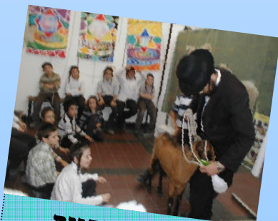
בע"ה אמיתיים אם רק אפשר..