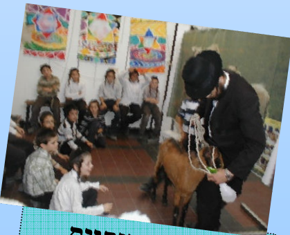
בע"ח אמיתיים אם רק אפשר..

למי? הפעילות פועלת במסגרות לימוד בדרגות פירוט משתנות בהתאם לגיל והרקע של המשתתפים. כמו כן היא מתאימה לכל מי שרוצה לארח חוויה של לעתיד לבוא.. ניתן להעביר את הנושאים בצורת הרצאה בליווי מצגת