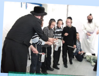
פס כסף בפסח

ברכות והמלצות מרבנים חשובים ממגזרים שונים!