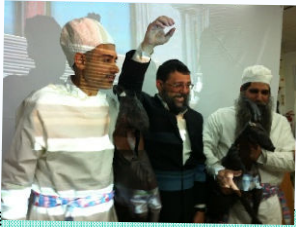
הגרלת יום הכפורים

לימודי המקדש וקדשים - גדולי הדורות הדגישו את חשיבות לימוד נושאי המקדש וקדשים, במיוחד בהקשר הציפיה לגאולה. בדורות האחרונים זכינו לחיבורים נפלאים בנושאים, ויחד עם זאת ראוי להמחיש ולהשיב אל הלב את הנושא לתלמידים עד כמה שניתן.